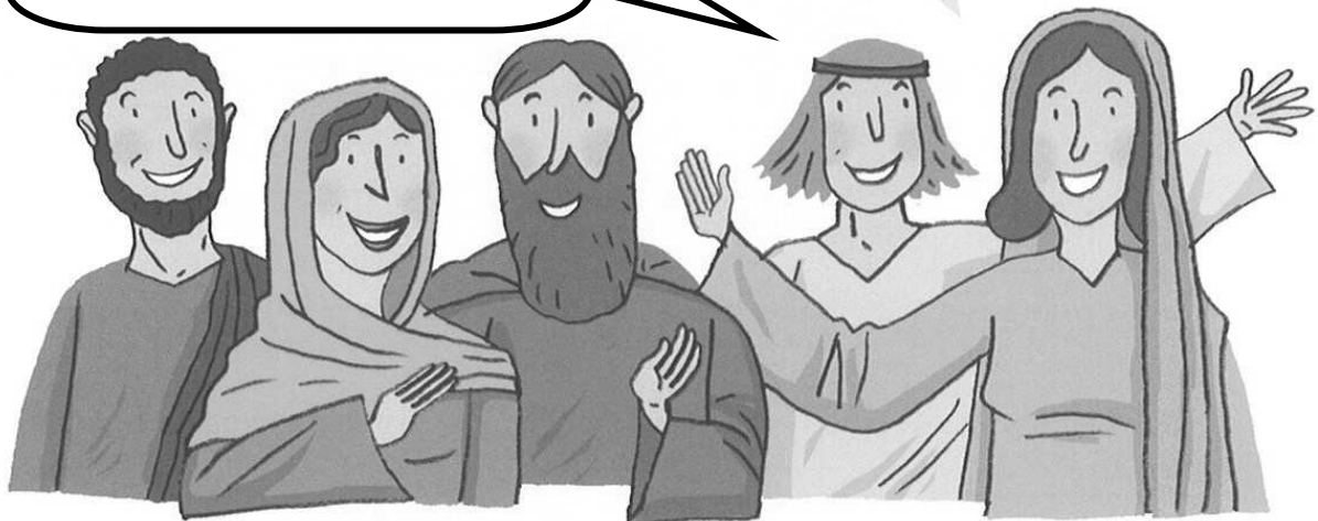
Anúnciase por todas partes a gran noticia: Xesús está vivo.